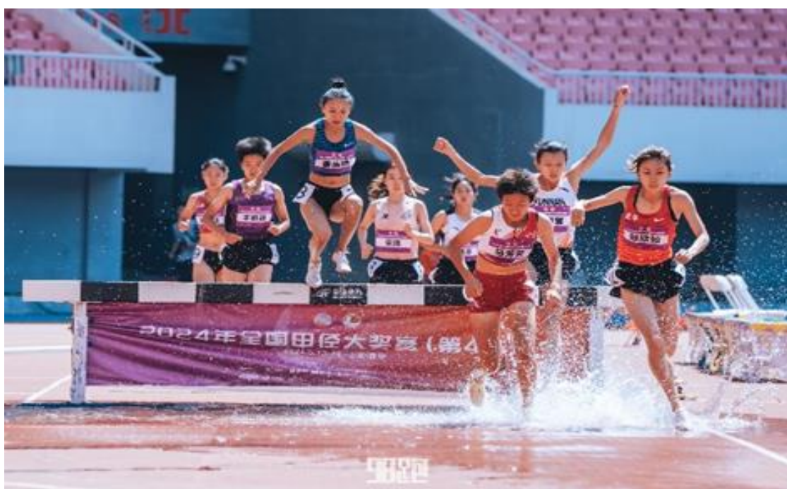
图 5 比赛图片