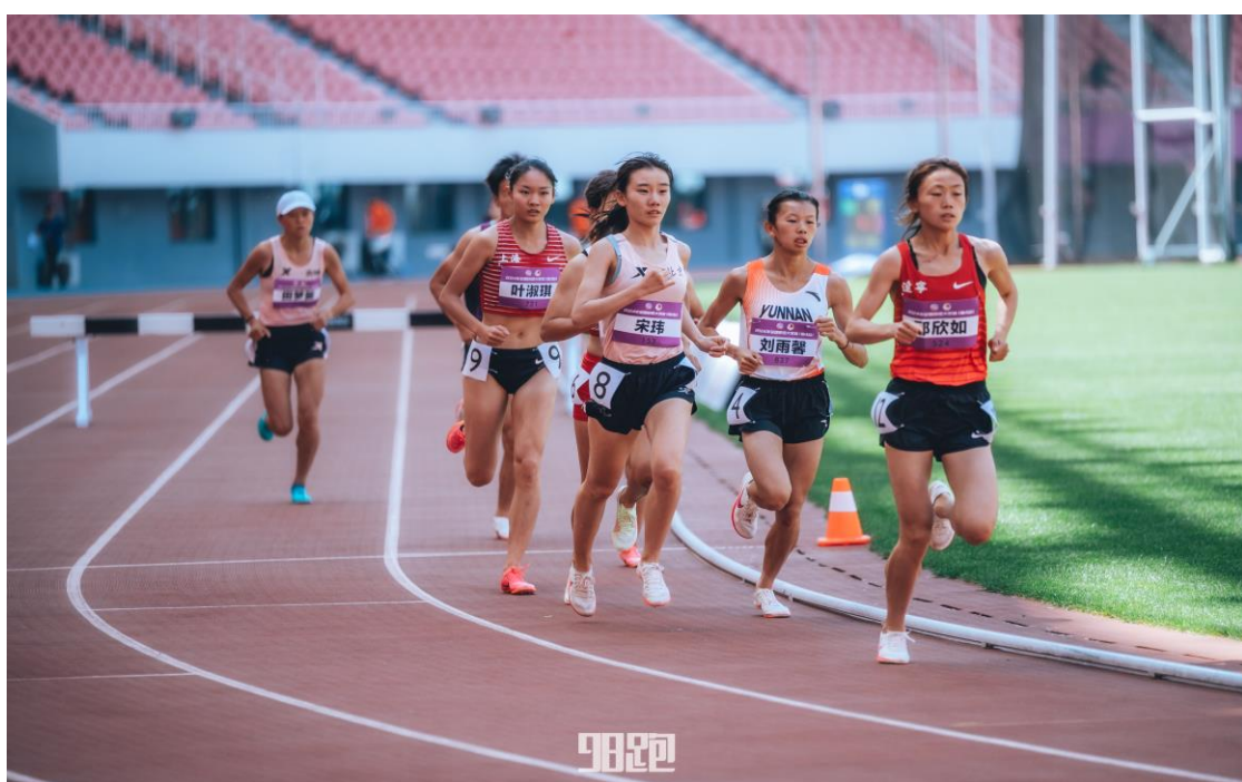
图 6 比赛图片