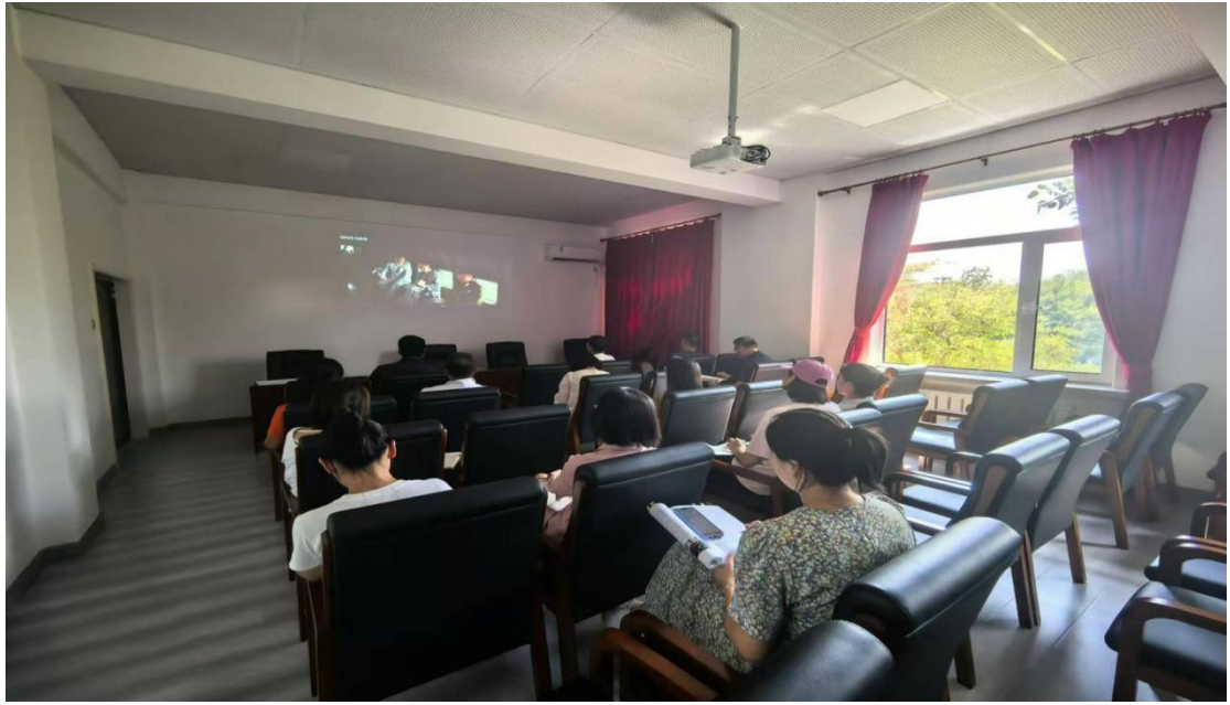
图 8 集中观看红色电影《建国大业》