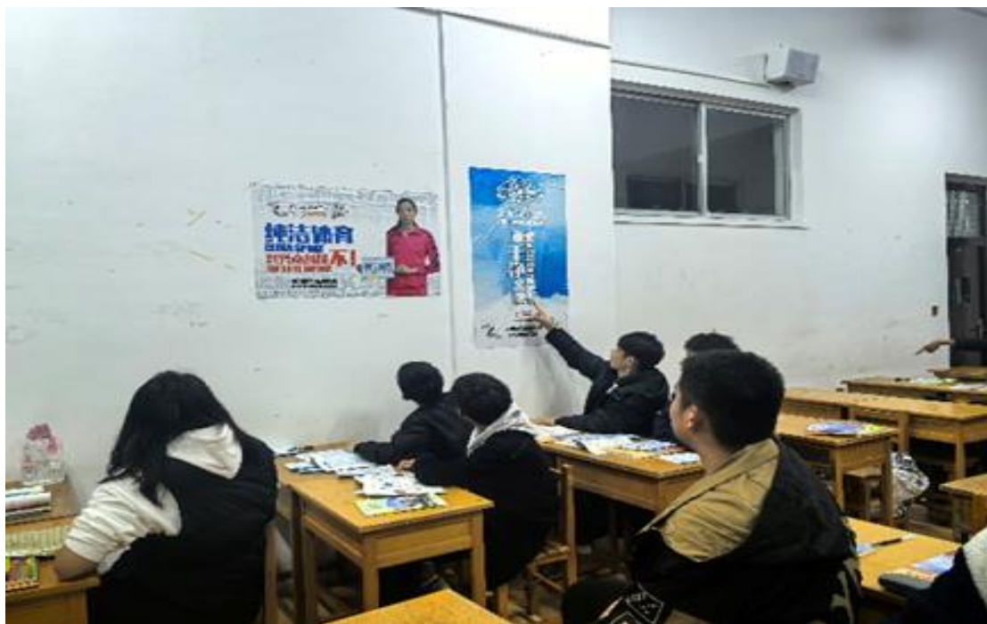
图 1 反兴奋剂主题教育