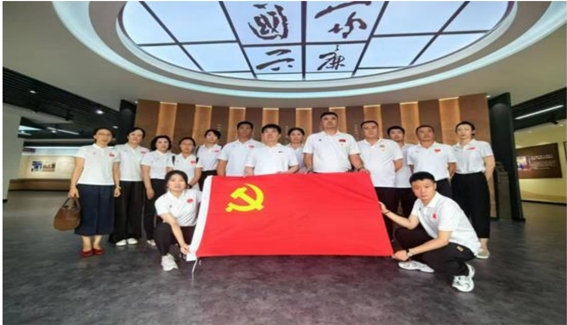
图 7 参观大连市“家廉国兴”反腐倡廉教育基地

组织的凝聚力和战斗力，也提升了居民对党组织的认同感和满意度。未来，学校将探索更多形式的体育健康活动，为居民们提供更加多元化、个性化的服务，努力打造健康、和谐、美好的社区环境。