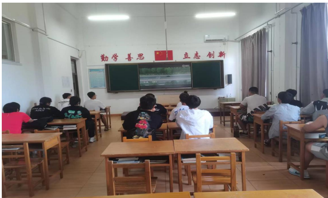
图 3 禁毒教育主题班会