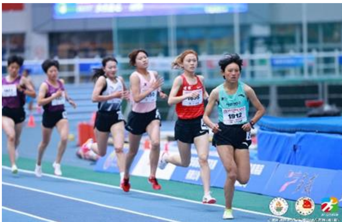
图 4 比赛图片

“以体育德”“以体育人”是最好的立德树人方式。不断重复和枯燥乏味甚至病痛折磨的艰苦训练可以磨砺坚韧不拔的意志品质，而百折不挠、永不言败、勇攀高峰的体育竞赛可以成就体育梦想。“德技相长”终有所成。本年度，学校组织参加 20 场比赛，其中 4 场室内赛、5 场大奖赛、1 场越野赛、1 场中学生运动会、2 场竞走锦标赛、2 场长投赛、1 场分区赛、1 场冠军赛、1 场全国锦标赛、1 场 u18 全国青年锦标赛、1 场辽宁省锦标赛，共计 140 余人次参赛，获得金牌 20 枚、银牌 13 枚、铜牌 33 枚。其中，1 名 2007 年出生的女子中长跑运动员已经完成本年度全运会积分，学校为其确定的阶段培养目标是明年力争获得参加 2025 年全运会决赛资格，并取得较好成绩。