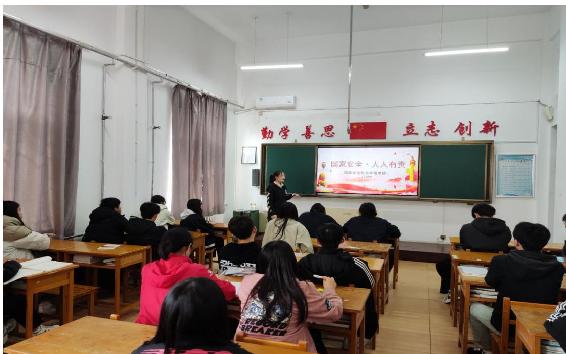
图 2 国家安全主题班会